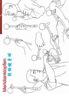
Tui NA An Mo und Meridianklopfen